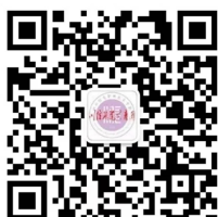
校团委微信公众号