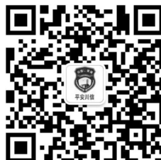
保卫处微信公众号