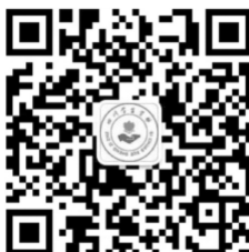
四川学生资助微信公众号