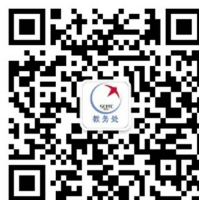
教务处微信公众号