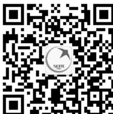
招生就业处微信公众号