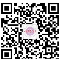
校团委微信公众号